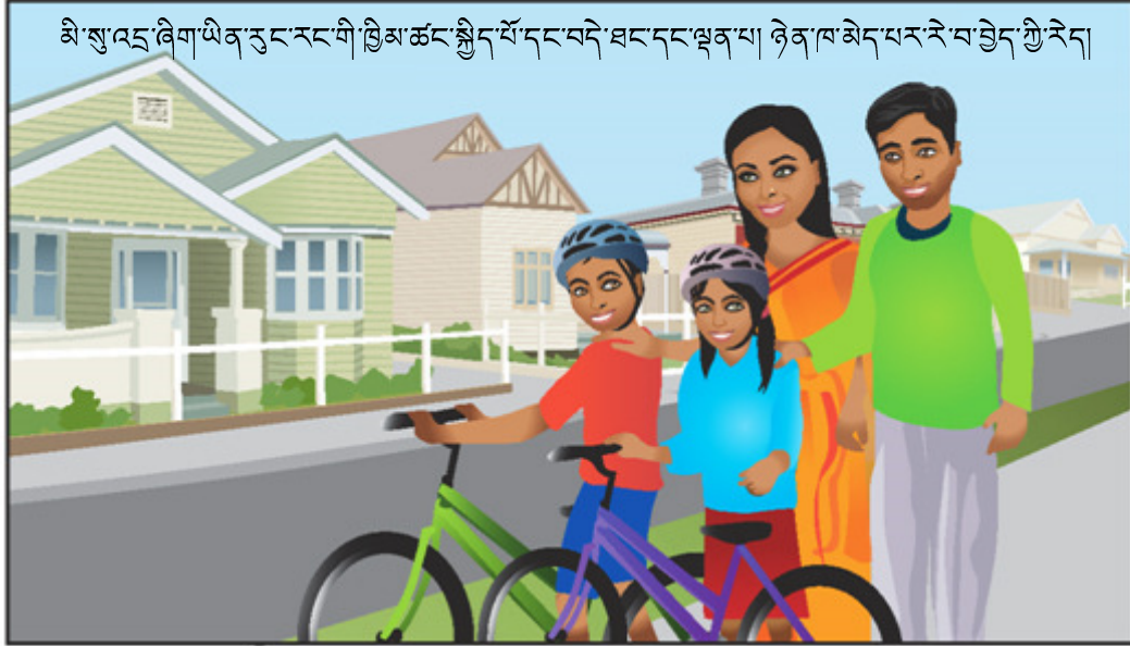
མི་སྲུང་ཞིག་ཡིན་ཅུང་རང་གི་བྲིམ་ཚང་སྤྱིད་སོ་དང་བདེ་ཐང་དང་ལྡན་པ། ཉེན་ཁ་མེད་པར་རེ་བ་བྱེད་ཀྱི་རེད།