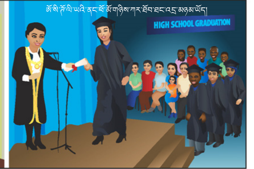
ཨོ་སི་ཤོ་ལི་ཡའི་ནང་སོ་སོ་གཉིས་ཀར་སོལ་ཐང་འདྲ་མཉམ་ཡོད།