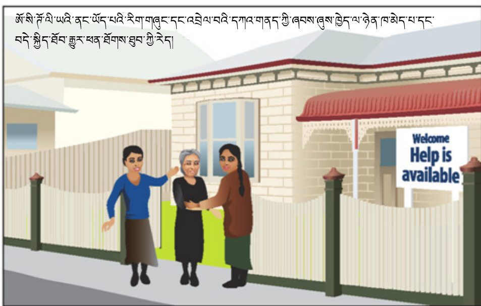
ཨོ་སི་ཤོ་ལི་ཡའི་ནང་ཡོད་པའི་རིག་གཞུང་དང་འབྲེལ་བའི་དཀའ་གནད་ཀྱི་ཞབས་ཞུས་བྱེད་ལ་ཉེན་ཁ་མེད་པ་དང་བདེ་སྤྱོད་སོལ་རྒྱུར་སོལ་ཐང་གོ་སྐོར་གྱི་རེད།