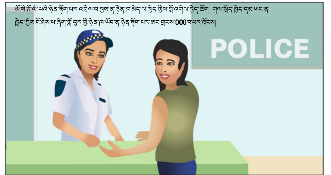
ཨོ་སི་ཤོ་ལི་ཡའི་ཉེན་རྒྱུད་ལ་འབྲེལ་བ་བྱས་ན་ཉེན་ཁ་མེད་ལ་བྱེད་ཀྱིས་སློབ་འགོལ་བྱེད་ཚོགས་གལ་སྲིད་བྱེད་དམ་ཡང་ན་བྱེད་ཀྱིས་རོ་གྲོལ་པ་ཞིག་སློབ་བྱེད་ཀྱི་ཉེན་ཁ་ཡོད་ན་ཉེན་རྒྱུད་ལ་འབྲེལ་བ་བྱས་ཀྱིས་འཕྲུལ་སྐད་སྒྲུབ་སྐད་སྒྲུབ་ལས་ཐོང་སྤྲོད།