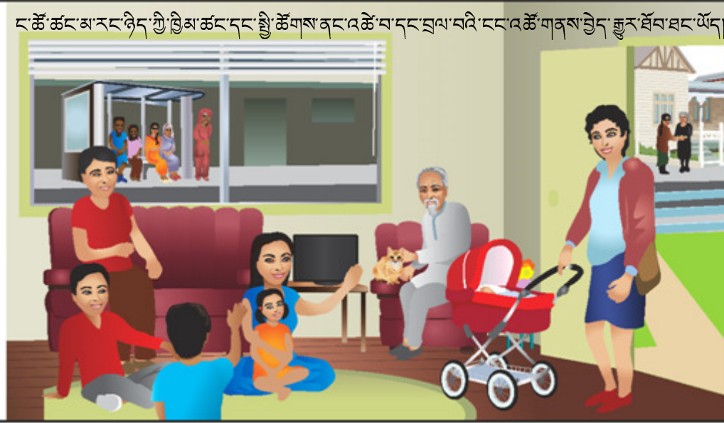
ང་ཚོ་ཚང་མ་རང་ཉིད་ཀྱི་བྲིམ་ཚང་དང་སྤྱི་ཚོགས་ནང་འཚོ་བ་དང་བྲལ་བའི་ངང་འཚོ་གནས་བྱེད་རྒྱུར་སོལ་ཐང་ཡོད།