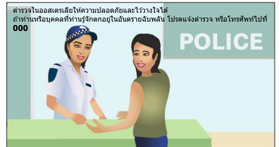
ตำรวจในออสเตรเลียให้ความปลอดภัยและไว้วางใจได้ ถ้าท่านหรือบุคคลที่ท่านรู้จักตกอยู่ในอันตรายฉับพลัน โปรดแจ้งตำรวจ หรือโทรศัพท์ไปที่ 000