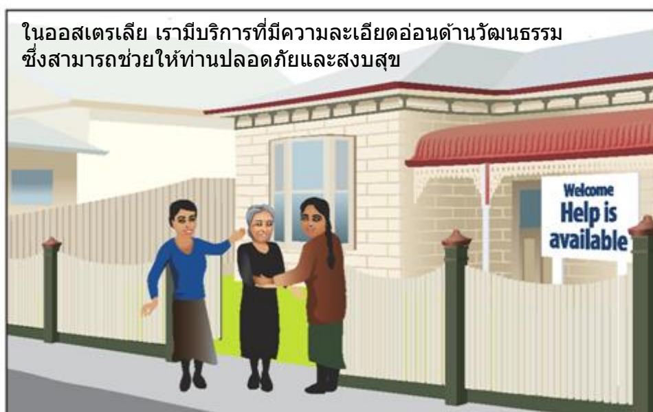
ในออสเตรเลีย เรามีบริการที่มีความละเอียดอ่อนด้านวัฒนธรรม ซึ่งสามารถช่วย给您ปลอดภัยและสงบสุข