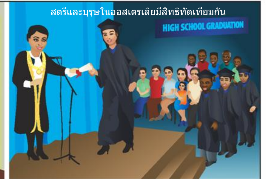
สตรีและบุรุษในออสเตรเลียมีสิทธิทัดเทียมกัน