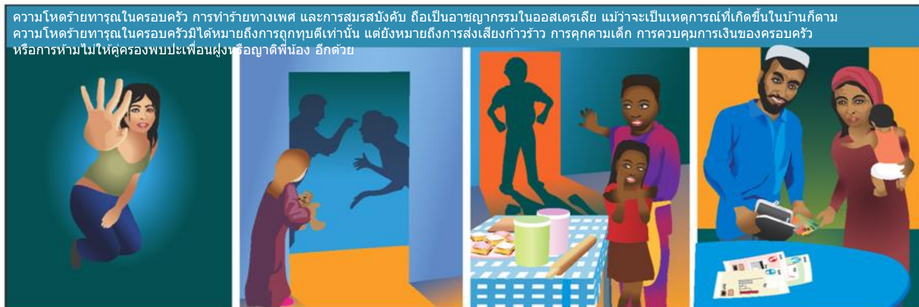
ความโหดร้ายทารุณในครอบครัว การทำร้ายทางเพศ และการสมรสบังคับ ถือเป็นอาชญากรรมในออสเตรเลีย แม้ว่าจะเป็นเหตุการณ์ที่เกิดขึ้นในบ้านก็ตาม ความโหดร้ายทารุณในครอบครัวมิได้หมายถึงการถูกทุบตีเท่านั้น แต่ยังหมายถึงการส่งเสียงก่วร้าย การคุกคามเด็ก การควบคุมการเงินของครอบครัว หรือการห้ามไม่ให้คู่ครองพบปะเพื่อนฝูงหรือญาติพี่น้อง อีกด้วย