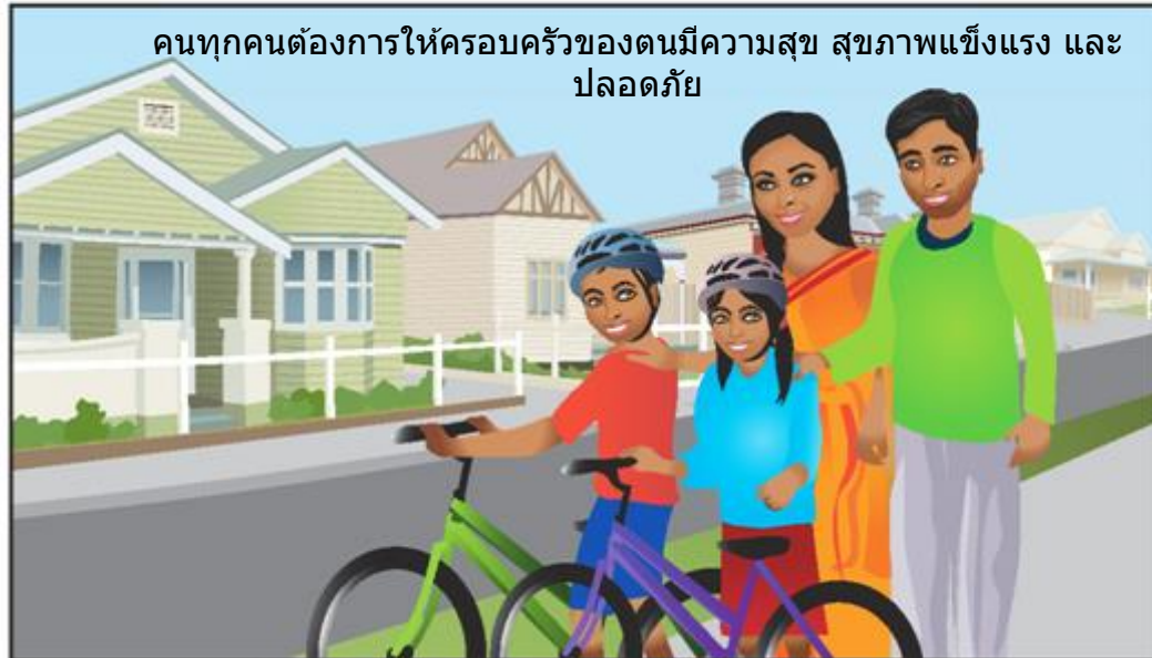
คนทุกคนต้องการให้ครอบครัวของตนมีความสุข สุขภาพแข็งแรง และปลอดภัย