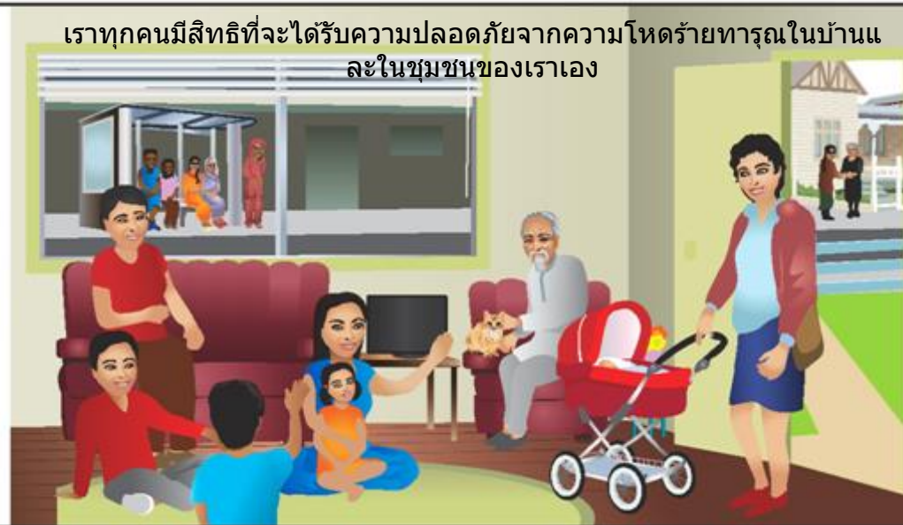
เราทุกคนมีสิทธิที่จะได้รับความปลอดภัยจากความโหดร้ายทารุณในบ้านและในชุมชนของเราเอง