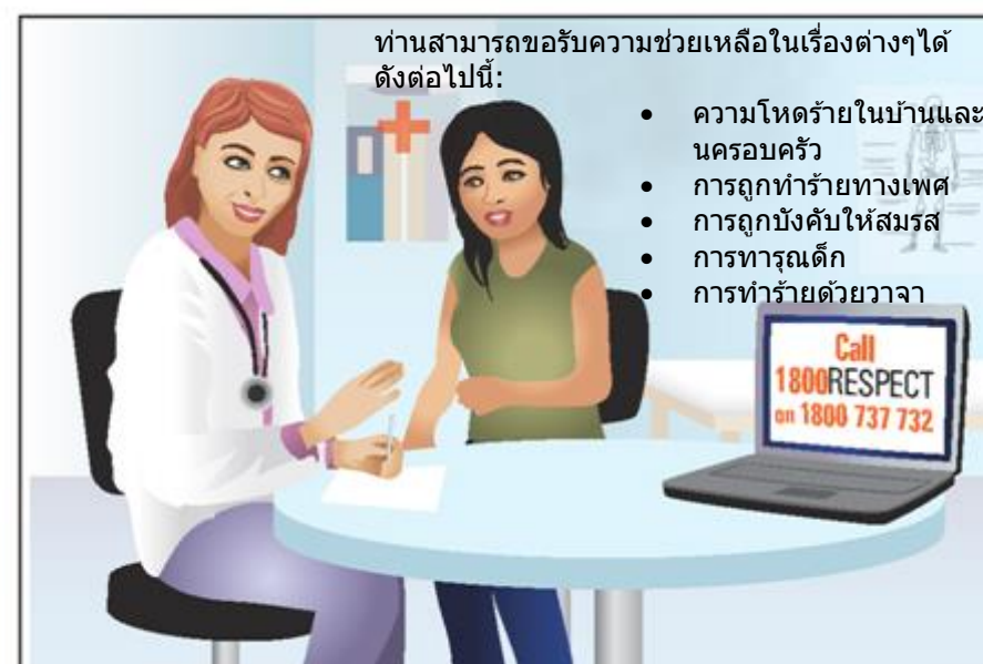
ท่านสามารถขอรับความช่วยเหลือในเรื่องต่างๆได้ดังต่อไปนี้: