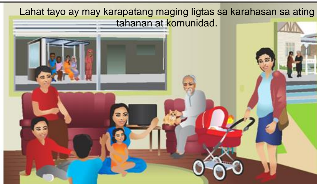
Lahat tayo ay may karapatang maging ligtas sa karahasan sa ating tahanan at komunidad.