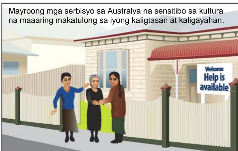
Mayroong mga serbisyo sa Australya na sensitibo sa kultura na maaaring makatulong sa iyong kaligtasan at kaligayahan.