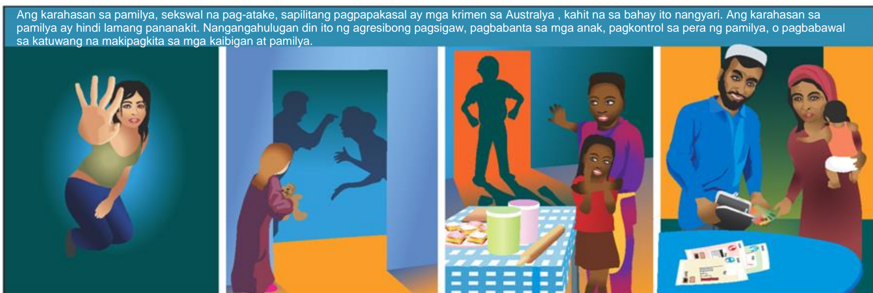
Ang karahasan sa pamilya, sekswal na pag-atake, sapilitang pagpapakasal ay mga krimen sa Australya, kahit na sa bahay ito nangyari. Ang karahasan sa pamilya ay hindi lamang pananakit. Nangangahulugan din ito ng agresibong pagsigaw, pagbabanta sa mga anak, pagkontrol sa pera ng pamilya, o pagbabawal sa katuwang na makipagkita sa mga kaibigan at pamilya.