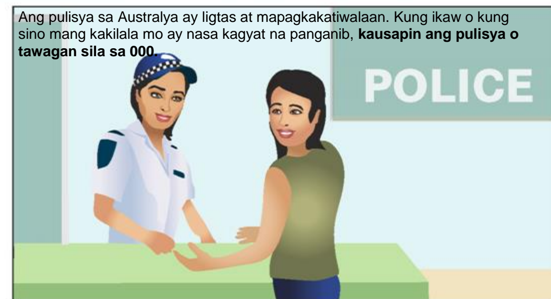
Ang pulisya sa Australya ay ligtas at mapagkakatiwalaan. Kung ikaw o kung sino mang kakilala mo ay nasa kagyat na panganib, kausapin ang pulisya o tawagan sila sa 000.