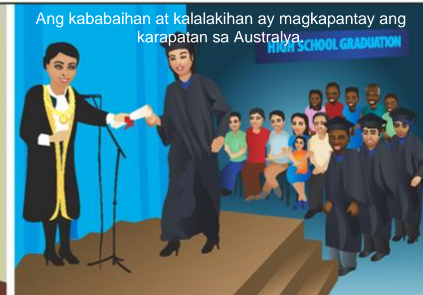
Ang kababaihan at kalalakihan ay magkapantay ang karapatan sa Australya.