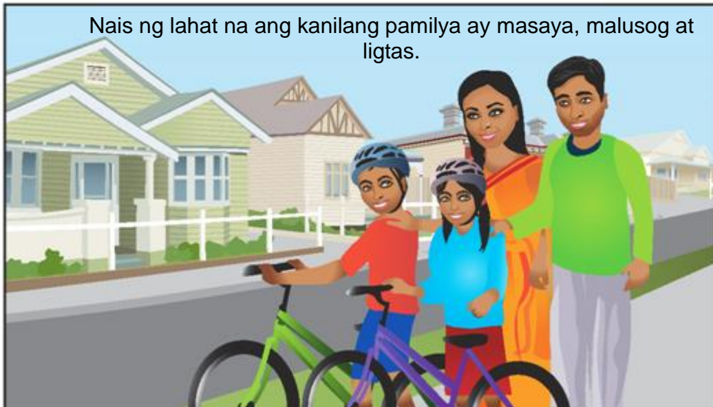
Nais ng lahat na ang kanilang pamilya ay masaya, malusog at ligtas.