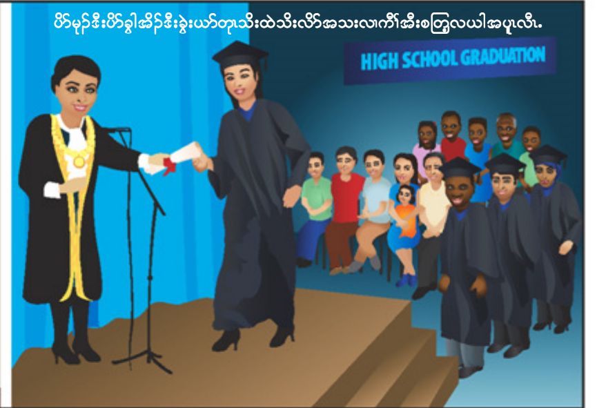
ပိဉ်မုဉ်ဒီးပိဉ်ခွါဆိဉ်ဒီးနွဲးယၢ်တုၤသီးထဲသီးလိာ်အသးလၢကိာ်အိးစတြဲလယါအပုလီၤ.

ဟံဉ်ဖိလိဖိတၢ်အဆူဉ်အစိးဒီးတၢ်အဆူဉ်ဖျိသးမ့ၢ်တၢ်မကမုဉ်ကွီၢ်မုဉ်လၢအိးစတြဲလယါအပု, မ့ၢ်မ့ၢ်လဲဉ်တၢ်အံၤကဲထီဉ်လၢဟံဉ်ပုန့ဉ်လီၤ. ဟံဉ်ဖိလိဖိတၢ်အဆူဉ်အစိးတဖၢ်ထဲတၢ်ဒီးတၢ်တီၢ်တခါစိးဘဉ်, ကတၢ်ကိးယါဆူဉ်ဆူဉ်, မပျံးမပျံးဖိတဖၢ်, ပိဉ်ယံးယၢ်ဟံဉ်ဖိလိဖိအစုမတမ့ၢ်တဖၢ်ထဲတၢ်ဒီးတၢ်သကိးဒီးဟံဉ်ဖိလိဖိတဖၢ်န့ဉ်လီၤ.