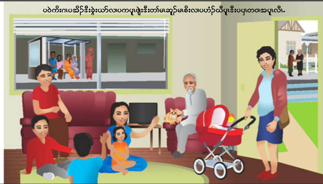
ပဝဲကီးကပဆိဉ်ဒီးနွဲးယၢ်လၢပကပုဖျးဒီးတၢ်အဆူဉ်အစိးလၢပဟံဉ်ပုဒီးပပုတတအပုလီၤ.