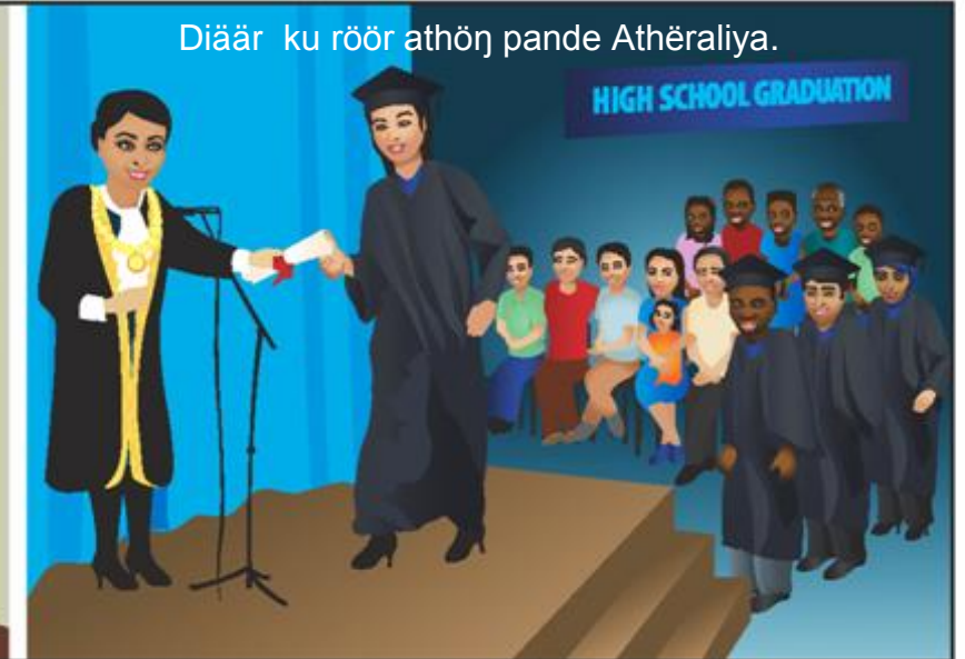
Diäär ku röör athön pande Athëraliya.

Tən baai, tēc ë riel ku thiənë riel ë kam ë kəc kën röth gam awēcdit arētīc në Athëraliya, agutë cəkë röt looi paandun. Tən baai acie ba yup. Alëu bë ya yi ba yī röl jat nhial apei, ba mīth thiät, ba kă baai (wëu ku kők yin ya) ya kōöl nhīm, ka ba tīndu ka monydu pën lo tē nən mēthke ku kəc ke ruääi.