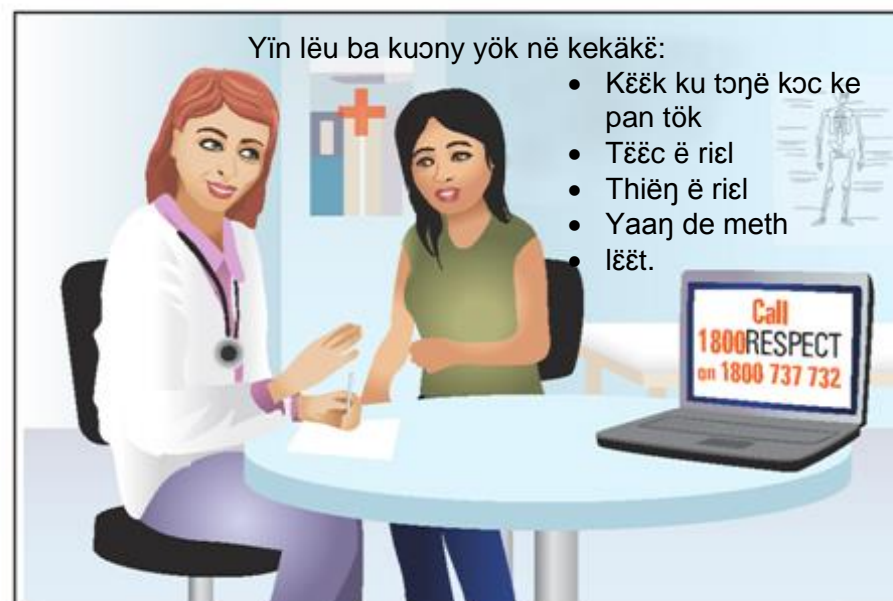
Yin lëu ba kuony yök në kekäkë: