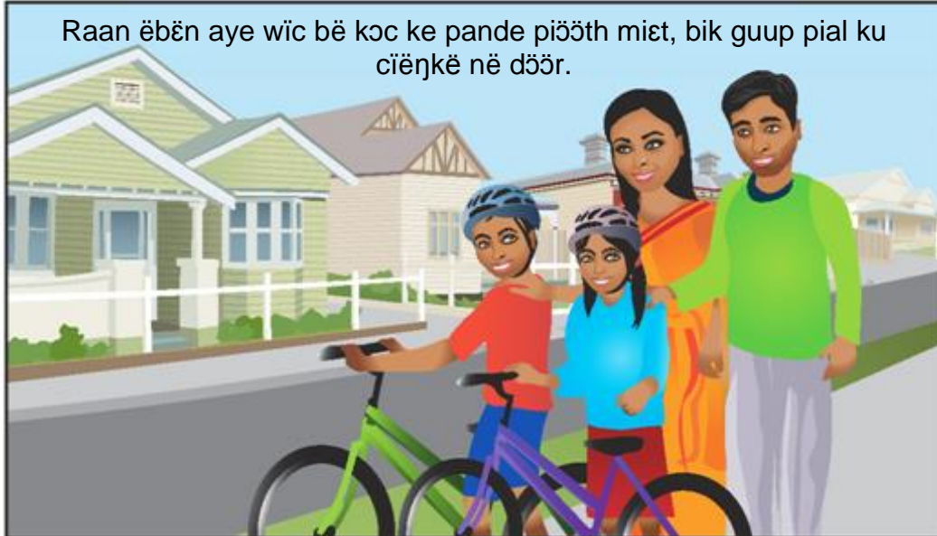
Raan ëbën aye wic bë kəc ke pande piöth miət, bik guup pial ku cïenkë në dšör.