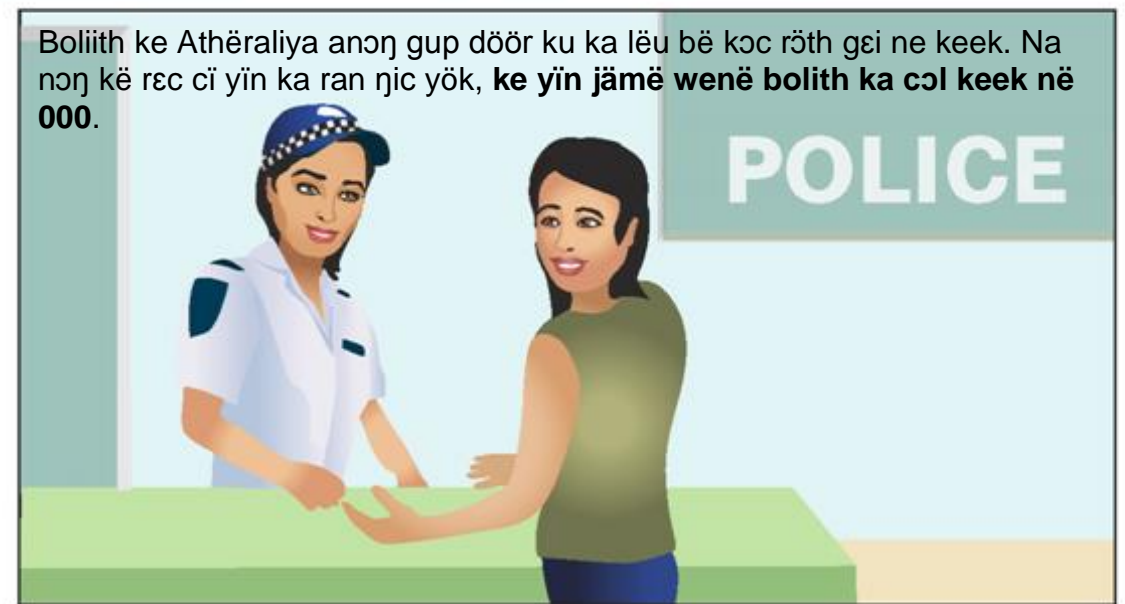
Boliith ke Athëraliya anən gup döör ku ka lëu bë kəc röth gei ne keek. Na nən kē rec cī yin ka ran njic yök, ke yin jāmë wenë bolith ka cöl keek në 000.