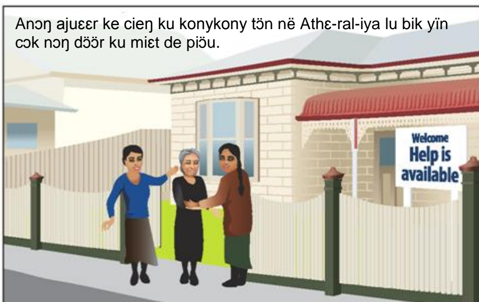
Anən ajuer ke cien ku konykony tən në Athë-ral-ya lu bik yin cək nən dšör ku miət de pišu.