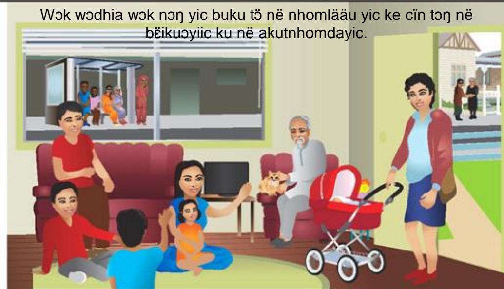
Wək wədhia wək nən yic buku tš në nholmäü yic ke cïn tənë bëikuoyiic ku në akutnholmdayic.